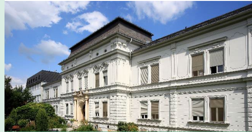
Standort Bad Radkersburg