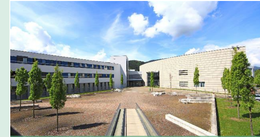
Standort Bruck a.d. Mur