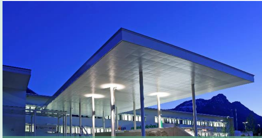
Standort Bad Aussee