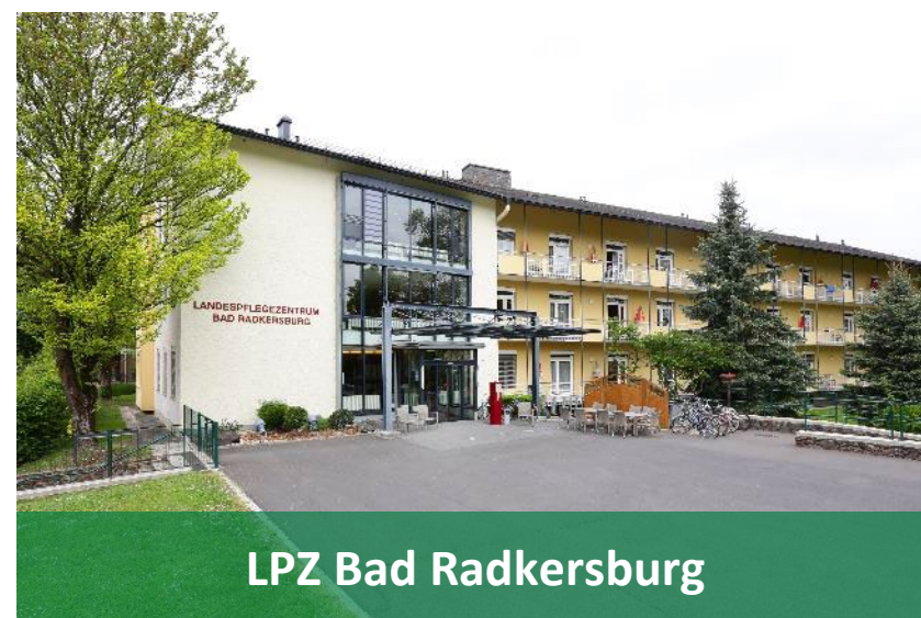
LPZ Bad Radkersburg